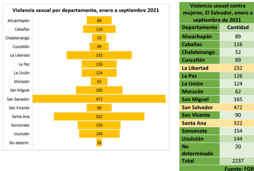
Gráfico 1. Violencia sexual por departamento (enero – septiembre, 2021)

En cuanto a los embarazos, en 2020 se registraron 1.456 casos de niñas y adolescentes de entre 10 y 19 años, 87 entre 10 y 14 años, y 1.369 entre 15 y 19 años. Si bien sigue siendo un problema, las estadísticas muestran una disminución de los casos en los años recientes, pasando de 1.870 embarazos en 2017, 1.728 en 2018, 1.607 en 2019 y los mencionados 1.456 en 2020.