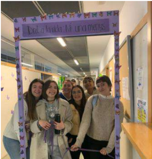
Alumnado del GM de Atención a Personas Dependientes.

En esta actividad se ha construido una puerta violeta decorada con mariposas. El objetivo de la misma es simbolizar el paso que dan las mujeres cuando salen de una situación de violencia, traspasar la puerta del maltrato y liberarse, emprender una vida de libertad y empoderamiento. Se pide al alumnado que la atraviesen para que con este simbolismo apoyen a todas esas mujeres víctimas de violencia de género que están pensando en dar ese pequeño gran paso.