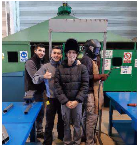
Construcción de la puerta violeta por parte del alumnado del GM de Instalaciones de Frío y Calor.