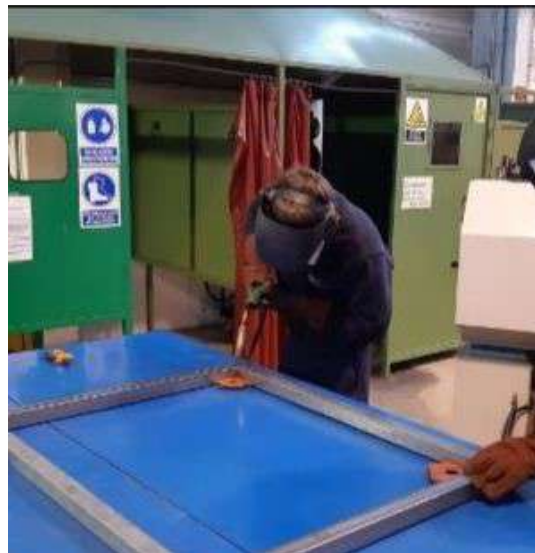
Construcción de la puerta violeta por parte del alumnado del GM de Instalaciones de Frío y Calor..